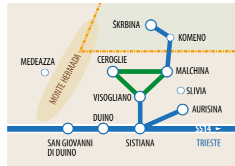
DESIGN: MASSIMO GOINA.COM

UN GRAZIE AL "TERRITORIO" PER LA GENTILE COLLABORAZIONE ZA PRIJAZNO SODELOVANJE SE ZAHVALJUJEMO DANOSTIM S PROJEKTNEGA OMOBČJA WE ARE THANKFUL TO THE TERRITORIAL ENTITIES FOR THEIR KIND COLLABORATION