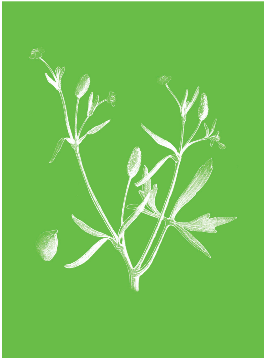
Renoncule scélérate Ranunculus sceleratus

On a dit que sa simple émanation amenait les larmes ; que ses qualités vénéneuses produisaient une contraction particulière des muscles de la face, que les anciens appelèrent rire sardonique . Nous avouons que nous n'avons jamais éprouvé les effets d'une plante qui ferait à la fois rire et pleurer.