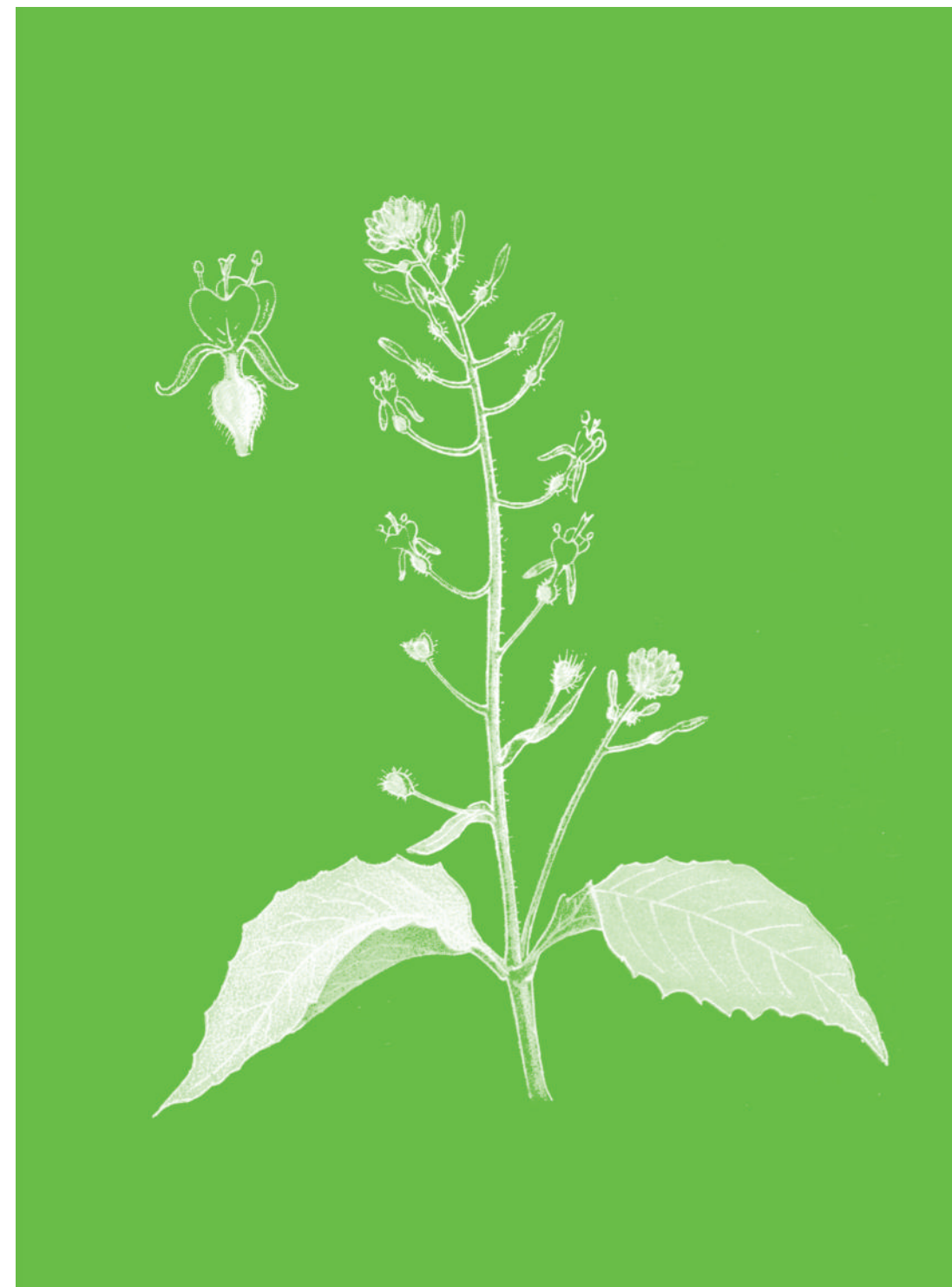
Circeae de Paris Circaea Lutetiana

En dépit de son nom, qui rappelle celui de la célèbre magicienne qui transforma en pourceaux les compagnons d'Ulysse, la Circeae ne possède bien entendu aucune vertu magique.