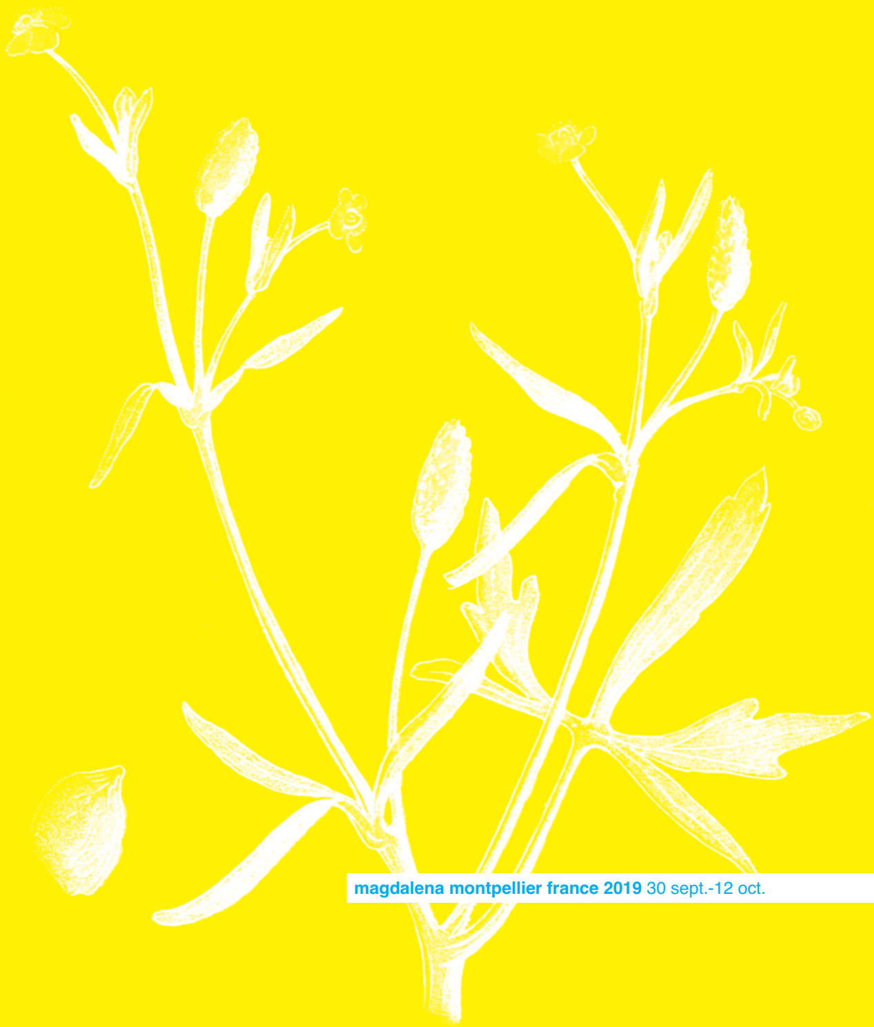
magdalena montpellier france 2019 30 sept.-12 oct.