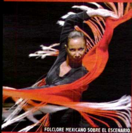
FOLCLORE MEXICANO SOBRE EL ESCENARIO.