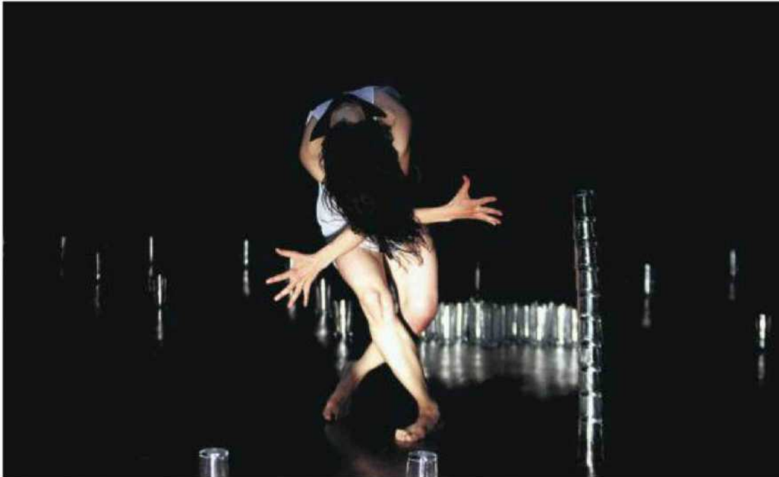
Un instante de la obra ¿Por qué lloran mis amores? , uno de los espectáculos que abren el festival.