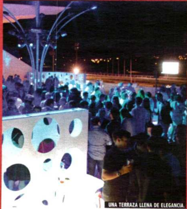
UNA TERRAZA LLENA DE ELEGANCIA.

Desde el 5 de septiembre y cada primer J de mes, varias salas de cine en España proyectarán una película de deportes de acción con motivo del ciclo 'Héroes por naturaleza'. Además de ver el filme, el espectador podrá asistir a una charla con los responsables del mismo en conexión via satélite. El primer título es Storm Surfers 3D , documental sobre los intentos de dos surfistas australianos por montar las olas más grandes. En Madrid la iniciativa puede verse este J 5 a las 19:30 h en Kinepolis y el Yelmo Ideal.