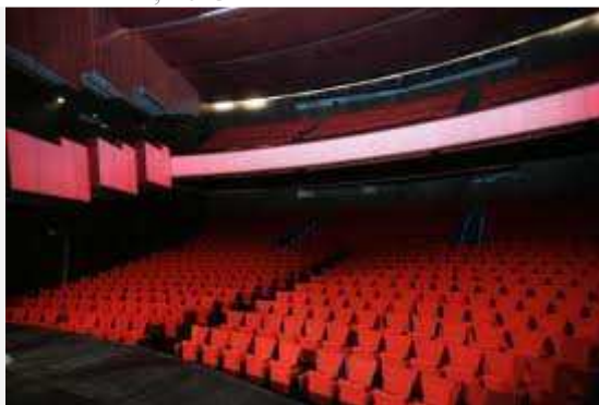
Teatro Canal.

Los Teatros del Canal de la Comunidad de Madrid presentan el ‘ A Solas ’, un festival de artes escénicas que nace en la Sala Verde, por donde pasará más de una treintena de mujeres de Asia, América y Europa .