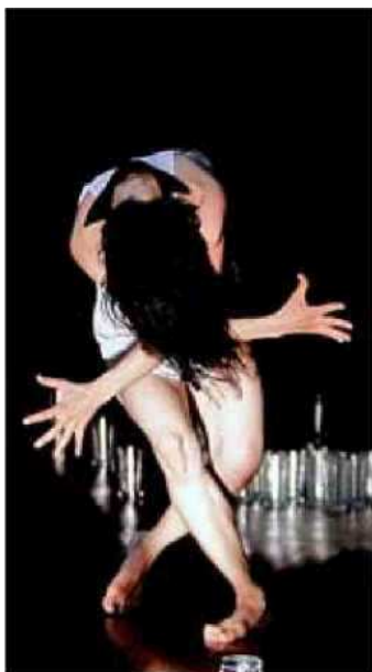
L'Explose, de Colombia. / E. M.