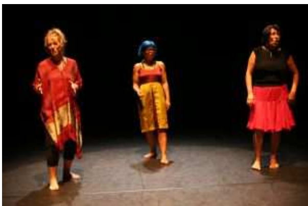
La compañía francesa Voix Polyphoniques.